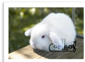
Coelho branco Coloração branca Cor branca

Para as pessoas que gostam dos mínimos detalhes podem acrescentar as palavras puro(s), uniforme ou monocolor após se referirem às cores. Por exemplo, podemos nos referir a um coelho Angorá branco uniforme, ou Angorá branco ou Angorá de coloração branca ou Angorá de coloração branca uniforme, etc.