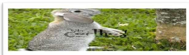
Cinza mesclado = Gris