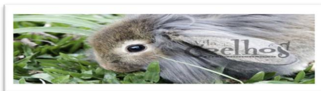
Preto cutia = Castor