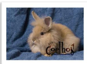
Coelho laranja Coloração laranja Cor laranja