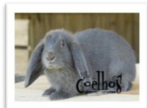
Coelho Azul Coloração azul Cor azul