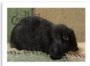
Coelho preto Coloração preta Cor preta

A) Colorações/Cores puras, uniformes ou apenas monocolor: quando os pelos e os sub-pelos possuem cores lisas, ou seja, por toda a extensão do animal a tonalidade é idêntica, sem a interferência de tons ou sobretons. Como exemplos as cores azuis, brancas, laranjas, pretas, vermelhas, etc.