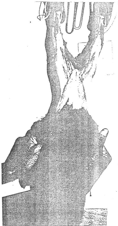
Desveste-se, a pele de cima para baixo.