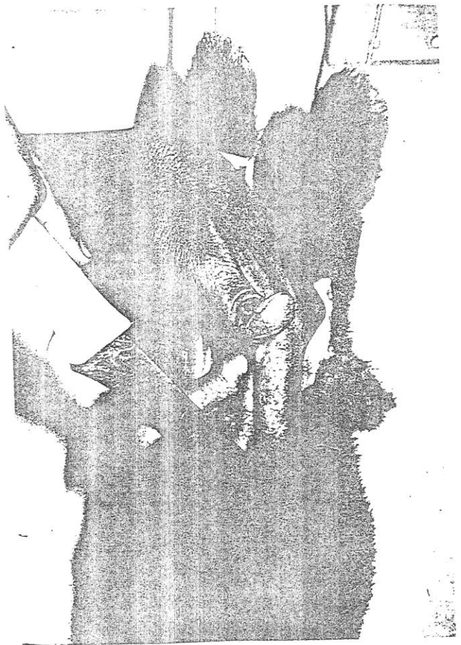
Corte em V para o início da esfolia.