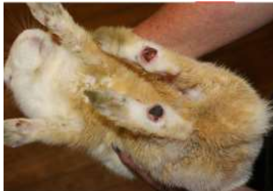
Figura 11. Coelho com lesões causadas por calosidade.

desenvolvimento de lesões nas superfícies plantares dos pés, por conta da pressão do peso sobre o piso. O diagnóstico é baseado na observação de lesões e profilaxia para a eliminação das causas que favoreceram a manifestação do problema (Papeschi, 2010). Nesses casos, é recomendada a utilização de apoio suave de material macio sobre o piso a fim de promover um descanso para o animal além da limpeza periódica da gaiola.