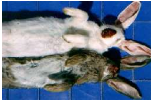
Figura 2 - Animais com sintomas da doença hemorrágica do coelho.

eutanásia de todos os animais e posterior incineração.