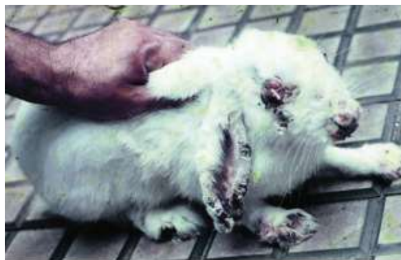
Figura 1. Coelho com mixomatose.