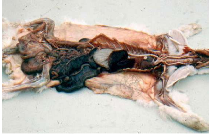
Figura 12. Calcificação das artérias em coelho. Todas as artérias deste coelho estão completamente calcificadas, transformadas em tubos rígidos de cor branca.

ocorrer são mínimas (Lieberman et al. 2013).