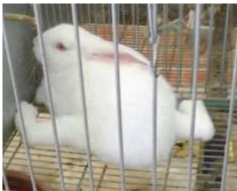
Figura 7. Coelho com Displasia coxofemoral.

A displasia coxofemoral também conhecida como pernas abertas é uma doença degenerativa (Trapp et al., 2010) que mesmo para animais de companhia é aconselhável a eutanásia. Em coelhos é extremamente danosa, pois além do desconforto gerado ao animal, ainda dificulta a cecotrofia causando desnutrição. Geralmente é visível no desmame e se manifesta mais intensamente no animal jovem com 40-60 dias (Figura 7).