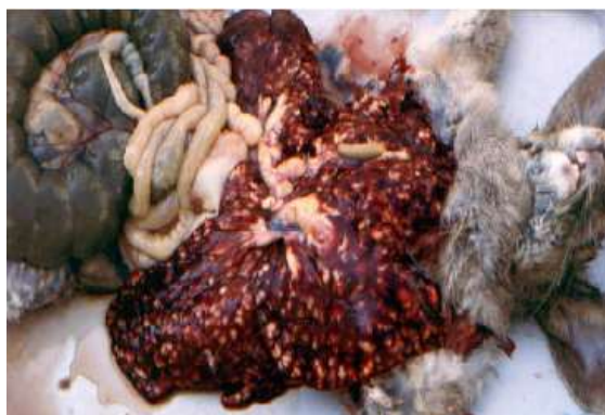
Figura 10. Coccidiose hepática. Atlas de Anatomia Patológica Veterinária da Faculdade de Medicina Veterinária de Lisboa (2016)

Coelhos com coccidiose significativamente diminuem a ingestão voluntária de alimentos e a digestibilidade das gorduras (Fekete e Kellems, 2007). A profilaxia consiste em limpeza e desinfecção das estruturas e aplicação de superfosfato de cálcio para impedir a maturação dos oocistos.