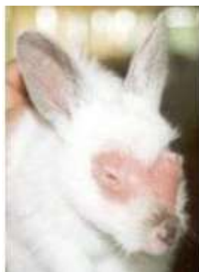
Figura 6 - Coelho com sintomas de dermafítose.

causadores dessa dermatite. De acordo com Samus (2016), os sinais são de micose, queda de pelo, lesão localizada, circular com eritema periférico, áspero e seco (Figura 6). Pode ocorrer devido à alta umidade, alta temperatura, contato com solos e gaiolas contaminadas (Samus, 2016), falta de higiene, falta de vitamina A e D.