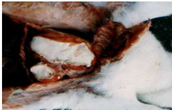
Figura 3 - Abcessos intratorácicos causados por Pasteurella spp.